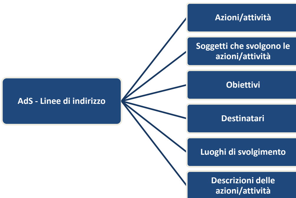
Figura n. 1 – Linee di indirizzo AdS: schema di sintesi degli elementi considerati